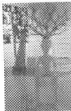
Figure ricoperte di lettere e numeri incomprensibili, simbolo dell'incomunicabilità. Ominidi dal cui corpo spuntano rami e fili elettrici. È l'arte suggestiva e inquietante di Gianni Cuomo...